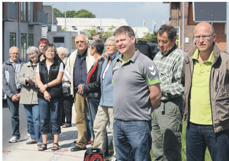
Flere borgere var mødt op for at tage del i indvielsen af omfartsvejen.