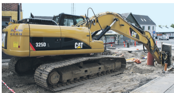
Store maskiner har overtaget bybilledet i Bredgade, og det vil de gøre en rum tid endnu. I foråret 2013 kan der så sættes endnu et flueben ud for et projekt, der er gjort færdig. Kunderne har gode adgangsmuligheder til butikkerne under hele fornyelsen af Bredgade.