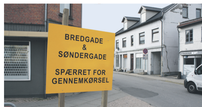
Det ligner et værre roderi i Bredgade i øjeblikket, men pulsspillet samles i løbet af det næste halve års tid, så Bredgade får et nyt og moderne look.