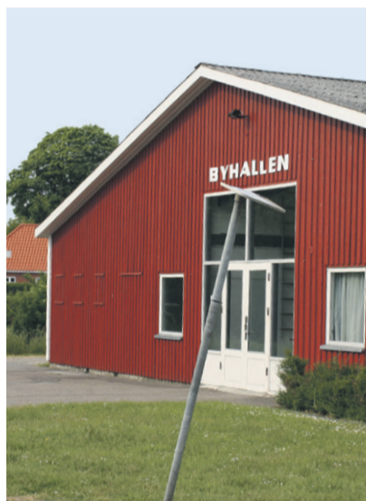
Byhallen er fortsat et samlingssted for større arrangementer i Kolind. Nu er der lagt op til, at en dialog mellem Byhallens ledelse og Syddjurs Kommune skal give plads til renovere både udearealer og inde i selve den store byhal.

De årlige kræmmermarkeder med det traditionsrige Hjordrengenes Marked den anden onsdag i september i spidsen er fortsat store tilløbsstykker og trækplastre.